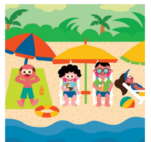
ARTICLE 24 Droit aux loisirs et au repos