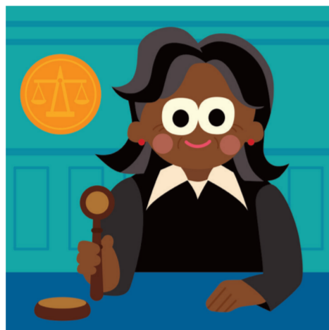
ARTICLE 8 Accès à la justice