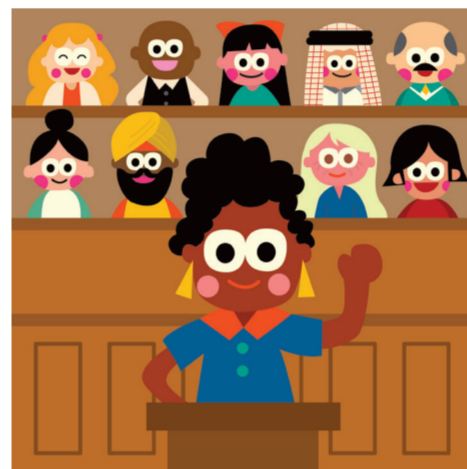
ARTICLE 10 Droit à un procès équitable