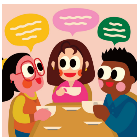
ARTICLE 19 Liberté d'expression