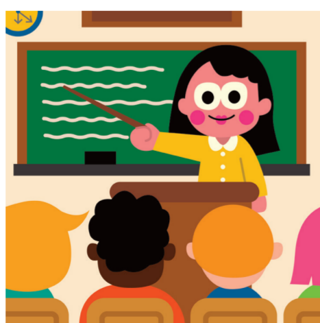
ARTICLE 26 Droit à l'éducation