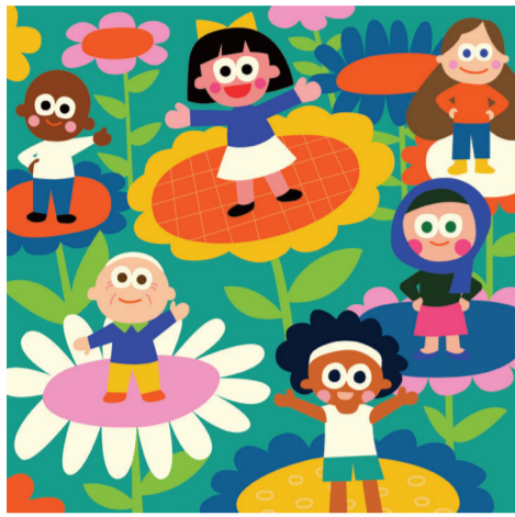
ARTICLE 1 Libres et égaux