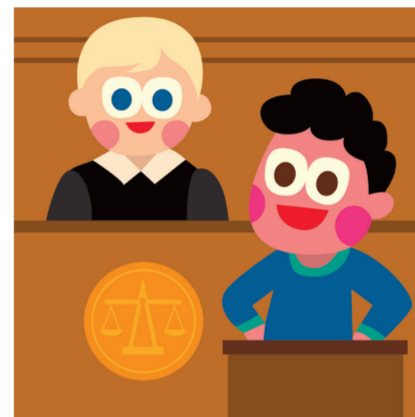
ARTICLE 11 Présomption d'innocence