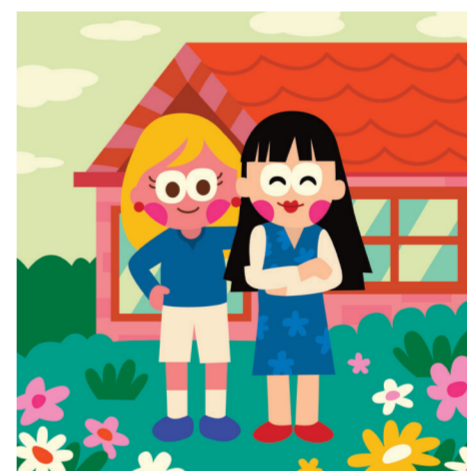
ARTICLE 17 Droit à la propriété