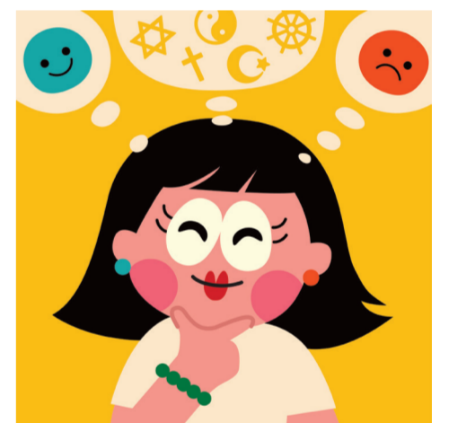
ARTICLE 18 Liberté de religion et de conviction