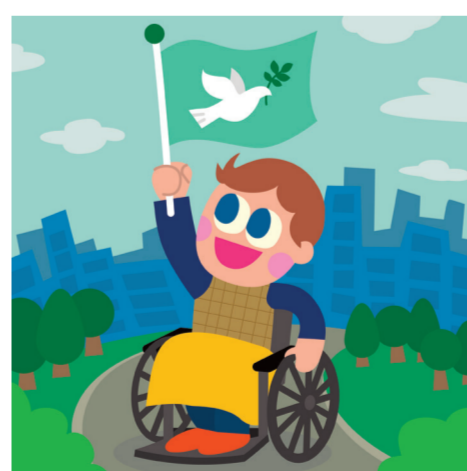
ARTICLE 28 Droit à un monde libre et équitable