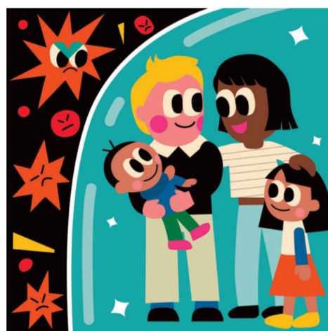
ARTICLE 14 Droit d'asile