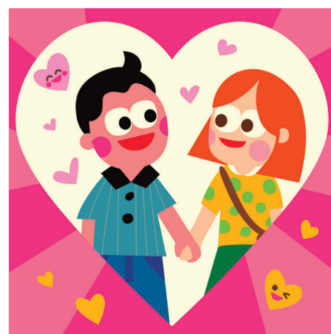
ARTICLE 16 Droit de se marier et de fonder une famille