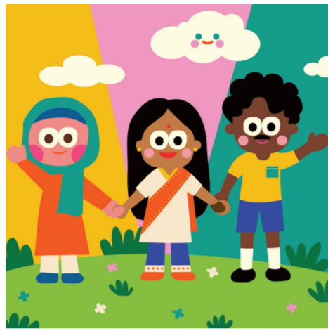
ARTICLE 2 Non-discrimination