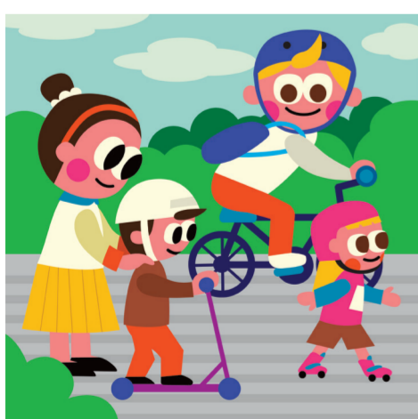
ARTICLE 25 Droit au niveau de vie adéquat