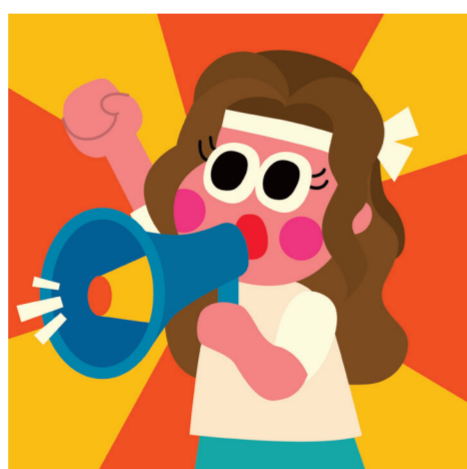
ARTICLE 20 Liberté de réunion