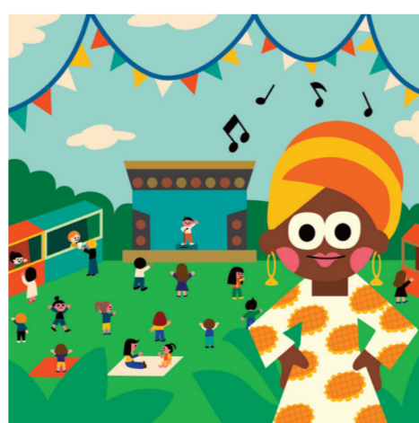
ARTICLE 27 Droit de participer à la vie culturelle, artistique et scientifique