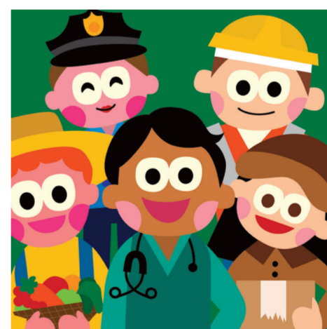
ARTICLE 23 Droit au travail