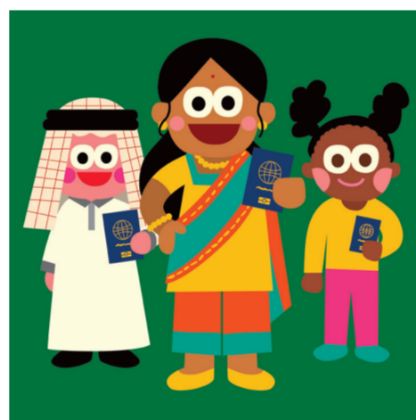
ARTICLE 15 Droit à la nationalité