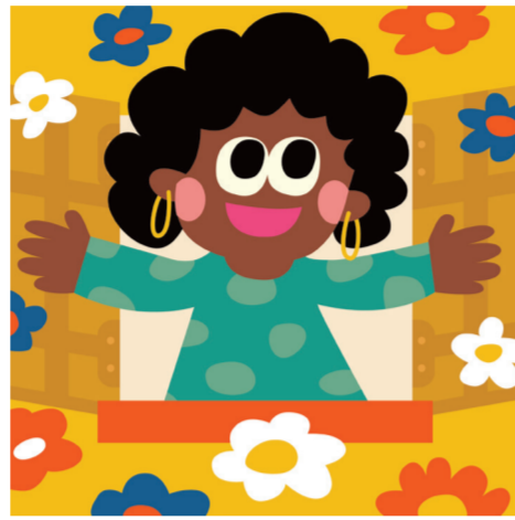
ARTICLE 3 Droit à la vie