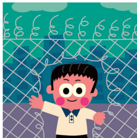
ARTICLE 9 Protection contre la détention arbitraire