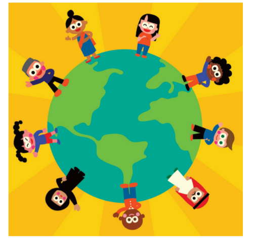
ARTICLE 6 Droit à la reconnaissance juridique