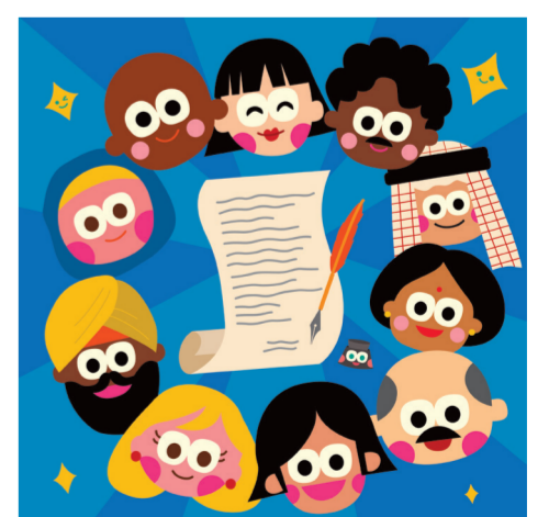
ARTICLE 30 Droits inaliénables