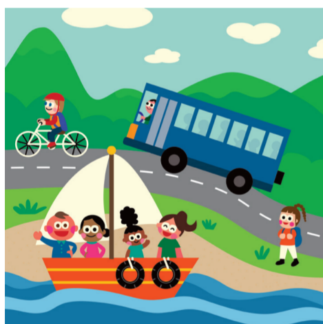
ARTICLE 13 Liberté de mouvement