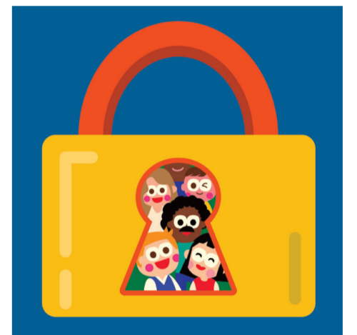
ARTICLE 12 Droit à la vie privée