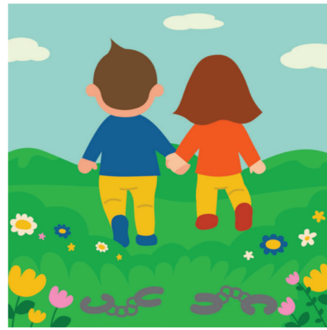
ARTICLE 4 Protection contre l'esclavage