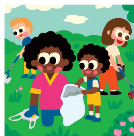
ARTICLE 29 Responsabilités à l'égard de votre communauté