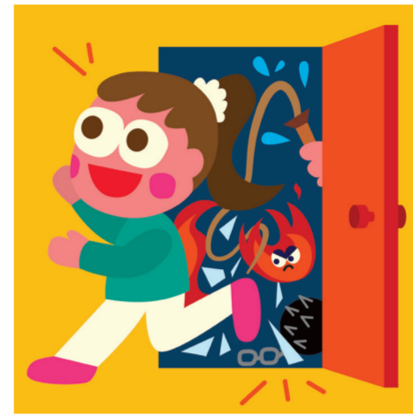
ARTICLE 5 Protection contre la torture