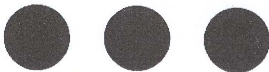
图 5. 有危险的工程和装置的特别国际标志

四、在夜间或能见度减弱时，可打开标志的灯光或将其照明。标志也可采用可使其通过探测技术手段被认出的材料制作。