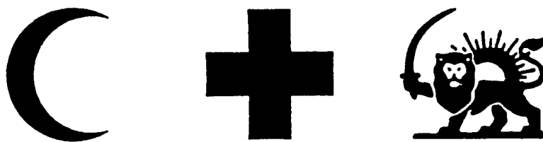
图2. 红色白底特殊标志

特殊标志(红色白底)应视情况适当大些。关于十字、新月或雄狮与太阳*的图形,各缔约国应以图2的示范为标准。