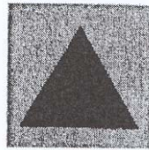
图 4. 配橙色底色的蓝色三角形

一、本议定书第六十六条第四款规定的民防人员特别国际标志为蓝色等边三角形配橙色底色。样式见图 4: