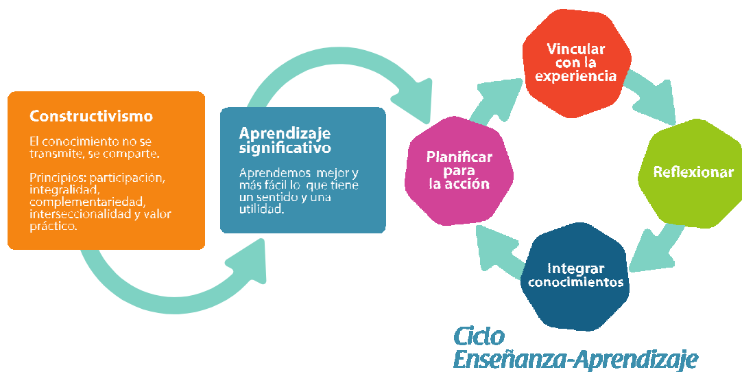
Figura 1. Ciclo de Enseñanza-Aprendizaje