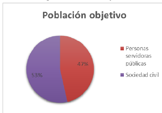
Figura 5: Población objetivo