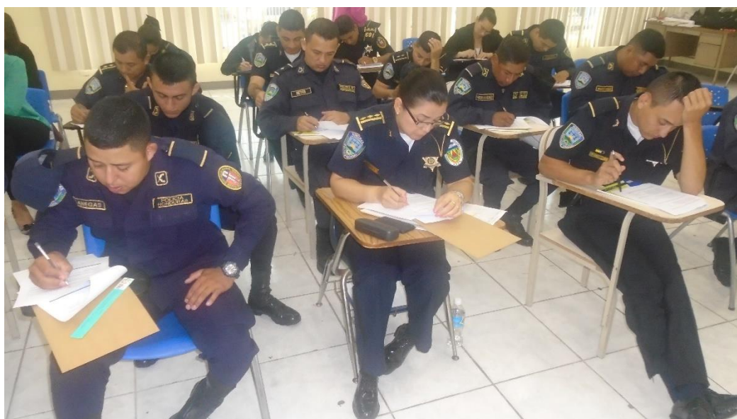
Cuadro No. 2 Participantes, miembros de cuerpos del Orden y FFAA. 2015-2016 2