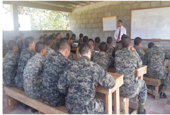
Soldados del Centro de Adiestramiento Militar del Ejército (CAME), Bijagual-Olancho, capacitados en Derechos Humanos.