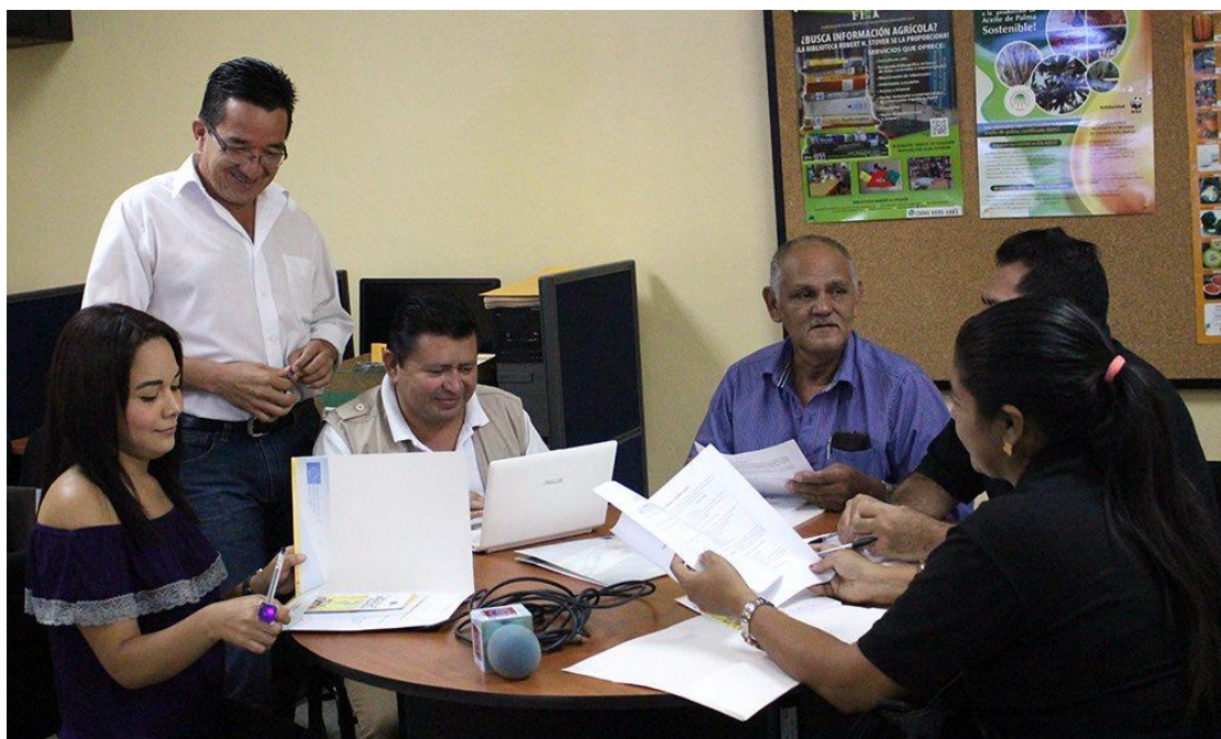
Periodistas y Comunicadores sociales. Fotografía SDHJGD IV Trimestre 2016.

Se capacitaron 87 periodistas del Interior del País (Comayagua, Danli, Juticalpa y Choluteca).