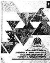
Módulo para instrucción