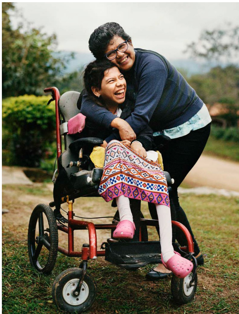
它被作为欧洲联盟项目“弥合差距II - 残障人士平等权利的包容性政策和服务”的一部分，并由国际和伊比利亚-美洲行政和公共政策基金会提供。