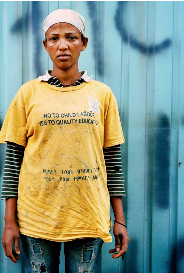
它被作为欧洲联盟项目“弥合差距II - 残障人士平等权利的包容性政策和服务”的一部分，并由国际和伊比利亚-美洲行政和公共政策基金会提供。