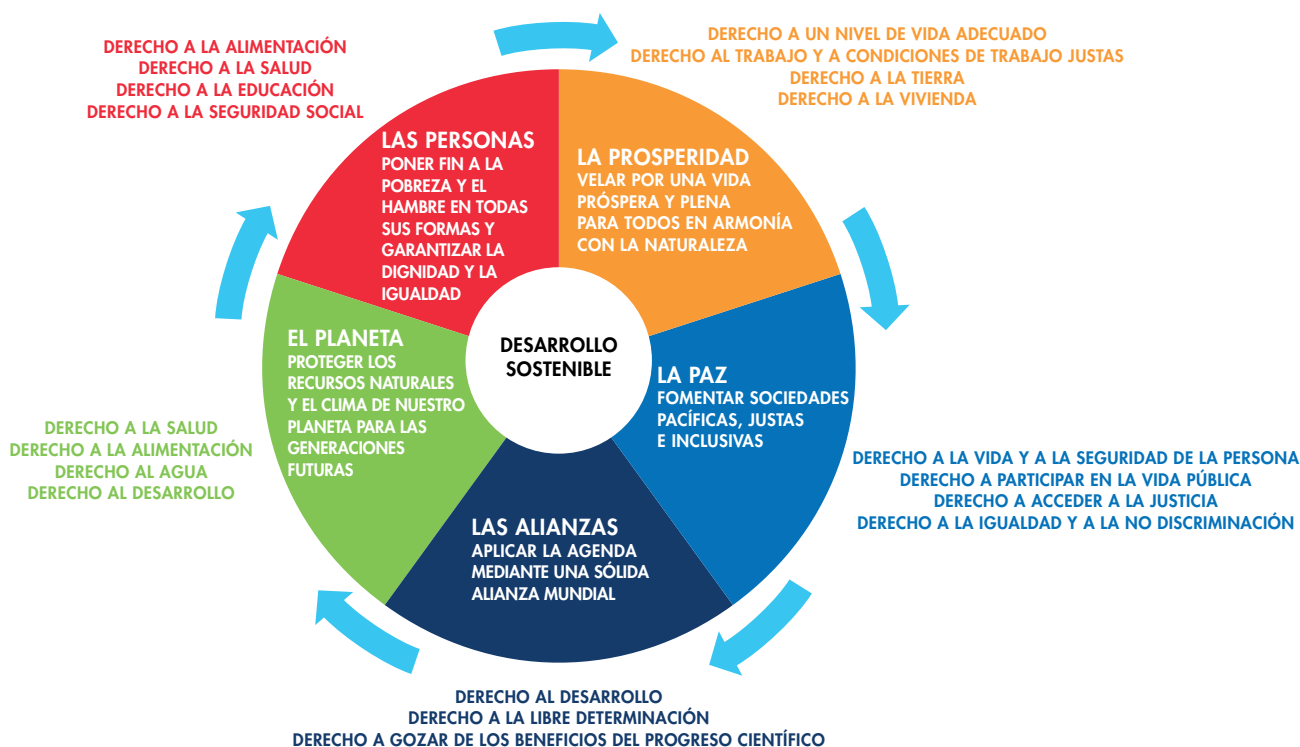
DESARROLLO SOSTENIBLE Y DERECHOS HUMANOS (FIGURA 1)

“La Vicesecretaria General de las Naciones Unidas, Amina Mohammed, en el discurso que pronunció en el 40° período de sesiones del Consejo de Derechos Humanos el 7 de marzo de 2019 dijo que “los derechos humanos son fundamentales para la Agenda 2030, y el desarrollo sostenible es un poderoso vehículo para hacer efectivos todos los derechos humanos”. Los derechos humanos son una forma eficaz de fortalecer la rendición de cuentas de los Estados en la consecución de los ODS. Aunque la Agenda 2030 no es un instrumento jurídicamente vinculante, los tratados internacionales de derechos humanos y la legislación nacional sí lo son. Cuando los ODS se analizan desde la óptica de los instrumentos de derechos humanos existentes, muchas de las metas de los ODS pasan de ser un objetivo o una aspiración a ser derechos inmediatos.