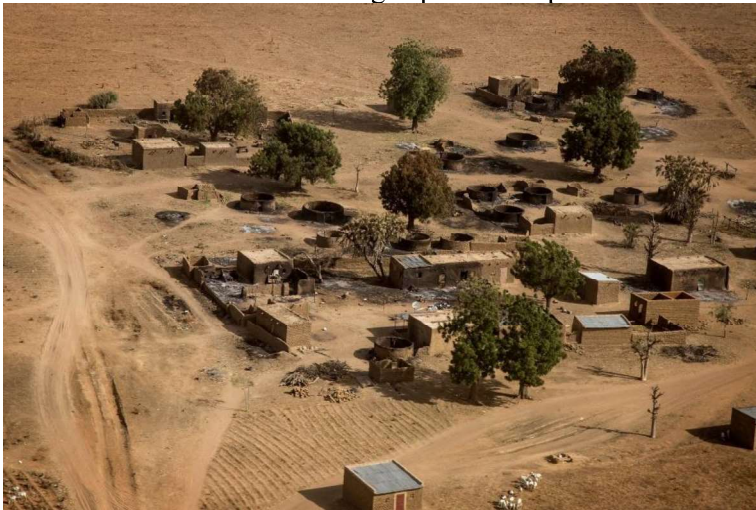
Photos 2 et 3: Greniers et cases en chaume incendiés au milieu du village de Koulogon-Peul