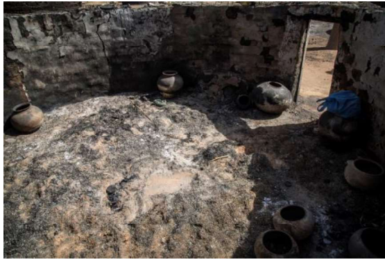
Photo 4 et 5 : Concession du chef de village où 8 personnes ont été tuées et calcinées