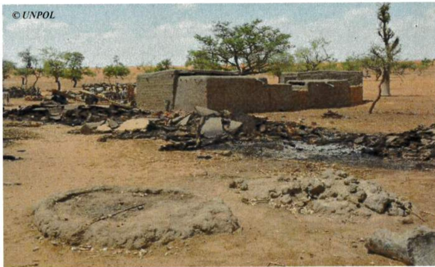
Une maison portant un signe de croix épargnée lors de l'attaque