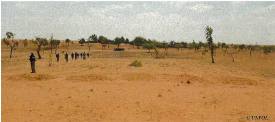
Les cinq fosses communes alignées côte à côte