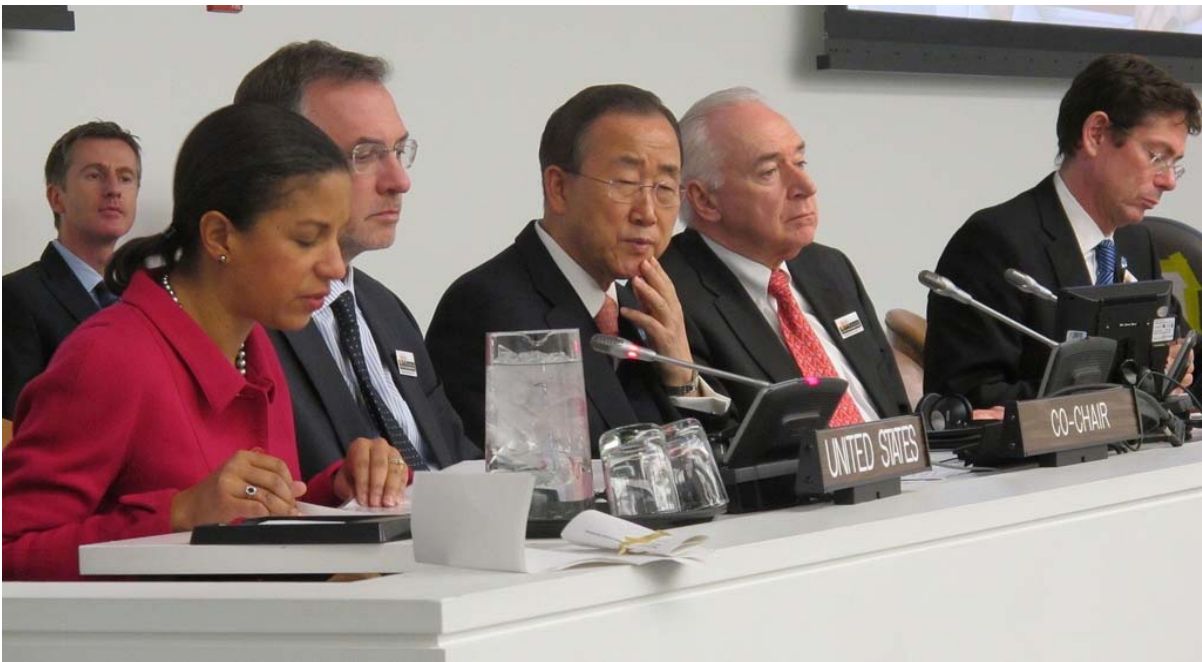
លោកអគ្គលេខាអង្គការសហប្រជាជាតិ បាន គីមូន ចូលរួមក្នុងកិច្ចពិភាក្សាលើសមភាពនៃមនុស្សស្រីស្រលាញ់ភេទដូចគ្នា មនុស្សប្រុសស្រលាញ់ភេទដូចគ្នា មនុស្សស្រលាញ់ភេទទាំងពីរ និង មនុស្សប្តូរភេទ (LGBT) នៅក្នុង ការិយាល័យអង្គការសហប្រជាជាតិ នៅទីក្រុងញូយ៉ក នាថ្ងៃទី ១០ ខែ ធ្នូ ឆ្នាំ ២០១០ ។

ទោះបីយ៉ាងណាក៏ដោយគោលការណ៍មិនរើសអើងមានភាពប្រទាក់ក្រឡាគ្នា ហើយកាតព្វកិច្ចរបស់រដ្ឋទាំងឡាយត្រូវមានជាបន្ទាន់។ និយាយជាសាមញ្ញ មនុស្សមិនអាចត្រូវបានរើសអើងចំពោះការទទួលបានសិទ្ធិ ដោយឈរលើមូលដ្ឋាននៃទំនោរផ្លូវភេទ និង អត្តសញ្ញាណយេនឌ័រឡើយ។ ដូចដែលខុត្តមស្នងការបានលើកឡើង “គោលការណ៍សកលភាពពុំអនុញ្ញាតឲ្យមានការលើកលែងឡើយ។ សិទ្ធិមនុស្សពិតជាសិទ្ធិដែលមានពីកំណើតរបស់មនុស្សគ្រប់រូប” 3 ។