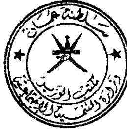
محمد بن سعيد بن سيف الكلباني وزير التنمية الاجتماعية

صدر في: ١ / ١١ / ١٤٣٣ هـ الموافق: ١٨ / ٩ / ٢٠١٢ م